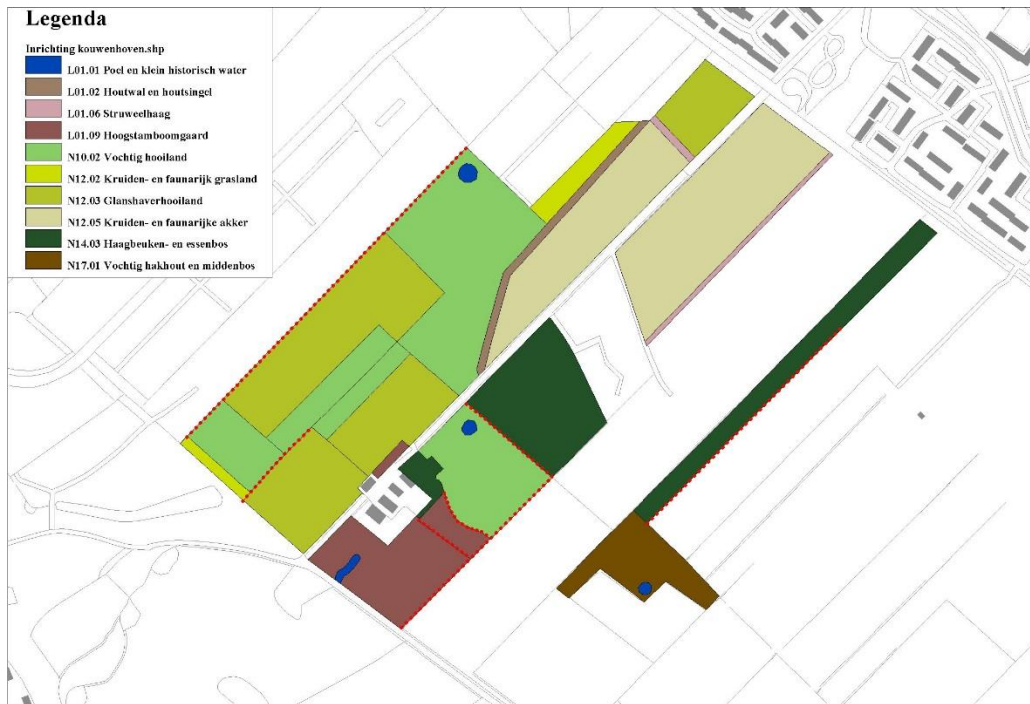
Figuur 4 inrichtingsplan Kouwenhoven, Niënhof (uit: Feijen, 2016)