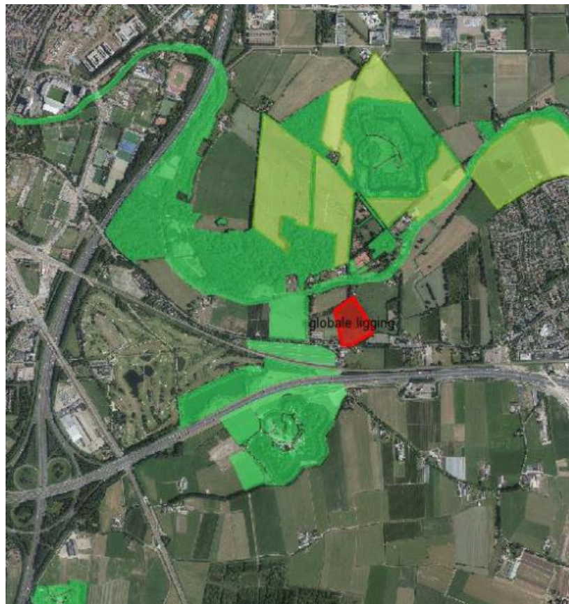
Figuur 2. Locatie van het Bunkerperceel (rood), EHS (donker groen) en groene contour (licht groen)