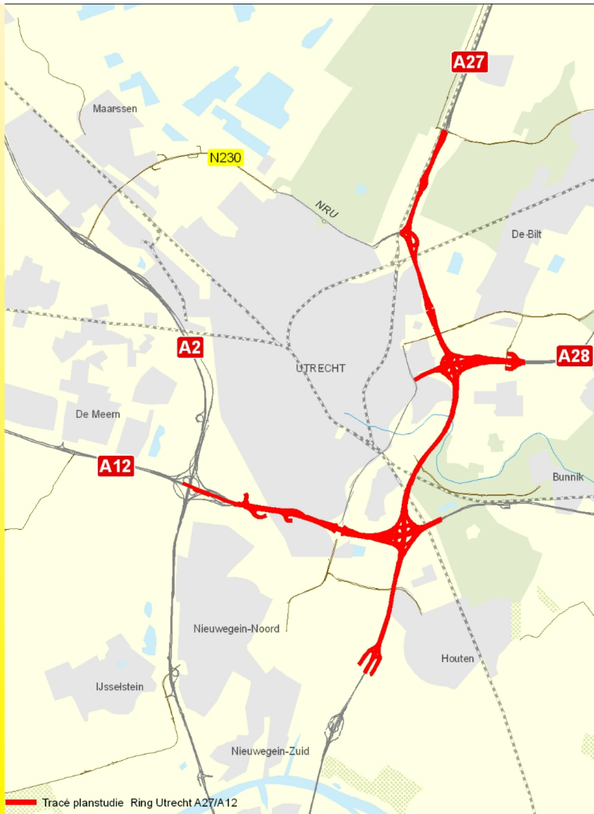
Tracé planstudie Ring Utrecht A27/A12